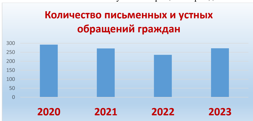
Количество письменных и устных обращений граждан

В Совете Камско-Устьинского муниципального района были приняты на личном приеме 131 гражданин, что на 28% больше уровня 2022 года. (2022г. -102). Все граждане приняты Главой муниципального района. Определены и строго соблюдаются единый день и часы приема граждан главой муниципального района, его заместителем - каждый вторник с 14 -00.